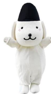
石川県 石浦神社 きまちゃん