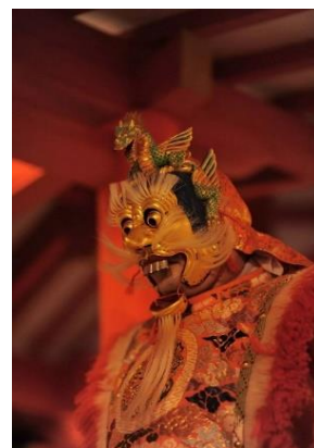
ゲスト：生田雅楽会