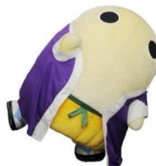
「©京都府 まゆまる 240001」